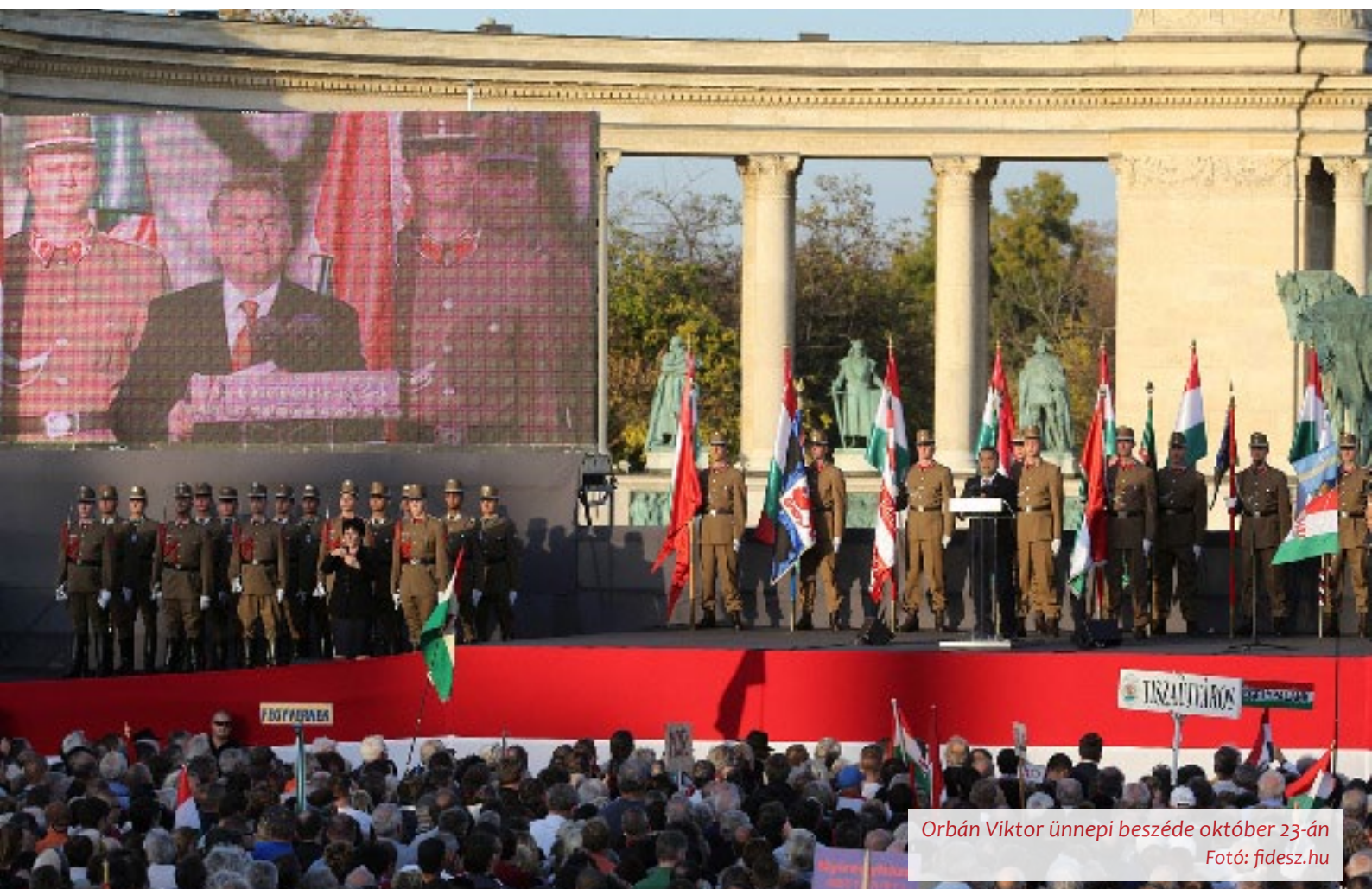
Orbán Viktor ünnepi beszéde október 23-án

A Fidesz elkötelezett amellett, hogy megvédje Magyarország gazdasági függetlenségét, a magyar családok biztonságát, ezért a leghatározottabban visszautasítja az EU nyomás gyakorlását. Az Országgyűlés politikai nyilatkozatot fogadott el a rezsicsökkentés védelméről, és ha szükséges, további lépéseket is tesz ennek érdekében. A 2014-es költségvetés-tervezet védi a rezsicsökkentést és számol vele, de már készül az a nonprofit közmujszolgáltatóról szóló törvény is, amely megtiltja, hogy a szolgáltatók extraprofitot számítsanak fel szolgáltatásaikért a családok kárára. Szóba jöhet még a rezsicsökkentés védelmének Alaptörvénybe foglalása is.