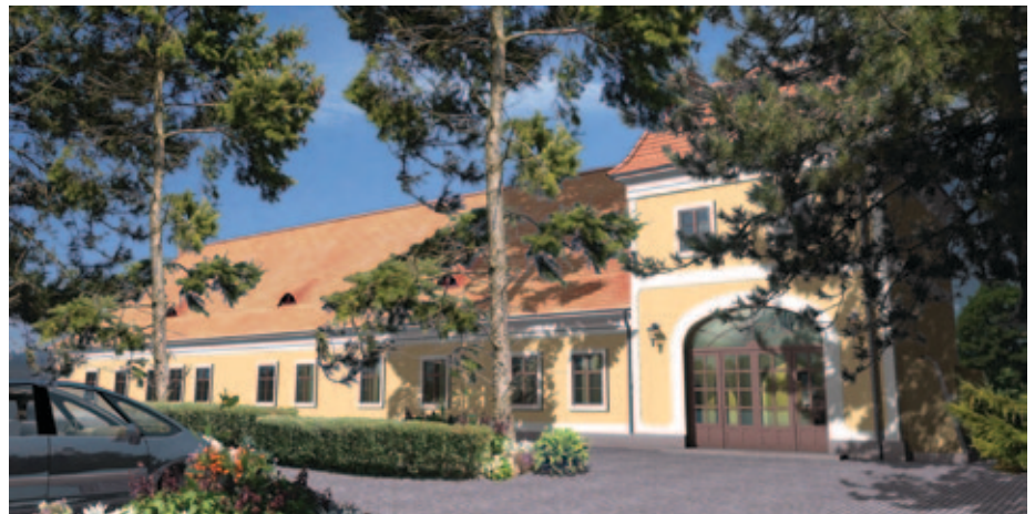
Ilyen lesz az egykori Festetics épület a felújítás után

Zajlik a település három ravatalozójának külső felújítása is, melyet ugyancsak pályázati segítséggel oldanak meg összesen 8,7 millió forintból.