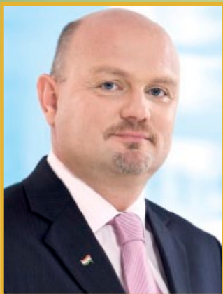
MÓRING JÓZSEF ATTILA országgyűlési képviselő 3. sz. választókerület